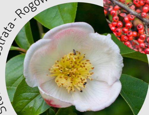
Syewartia rostrata - Rogów