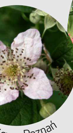
Rubus hevellicus - Poznań