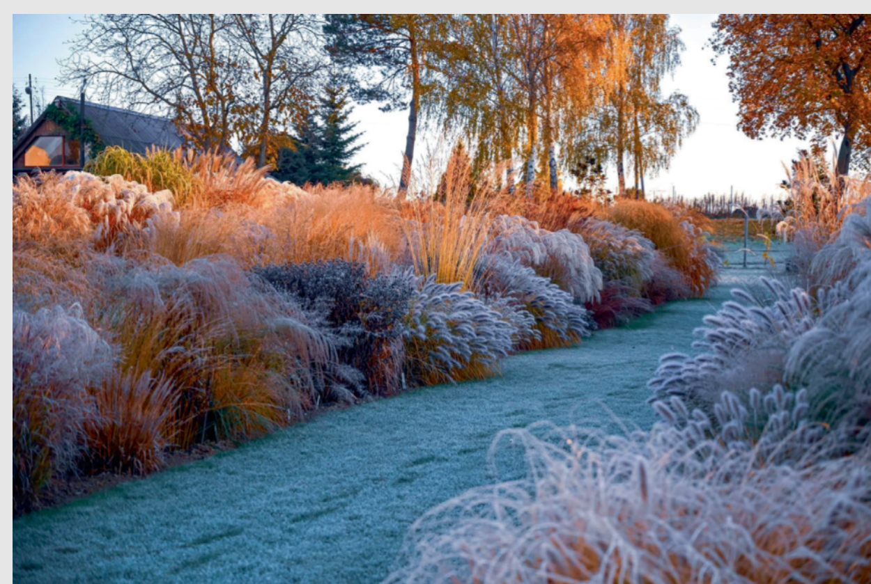
Narodowa Kolekcja miskantów w ogrodzie państwa Majów w Rykach