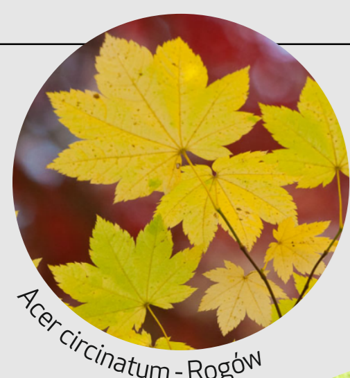
Acer circinatum - Rogów