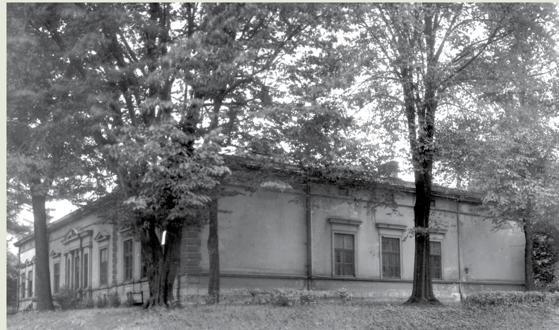
Widok zewnętrzny gmachu Wydziału Rolniczo-Lasowego – siedziby PTD przy ulicy św. Marka 1 we Lwowie, lata 1920-1939.