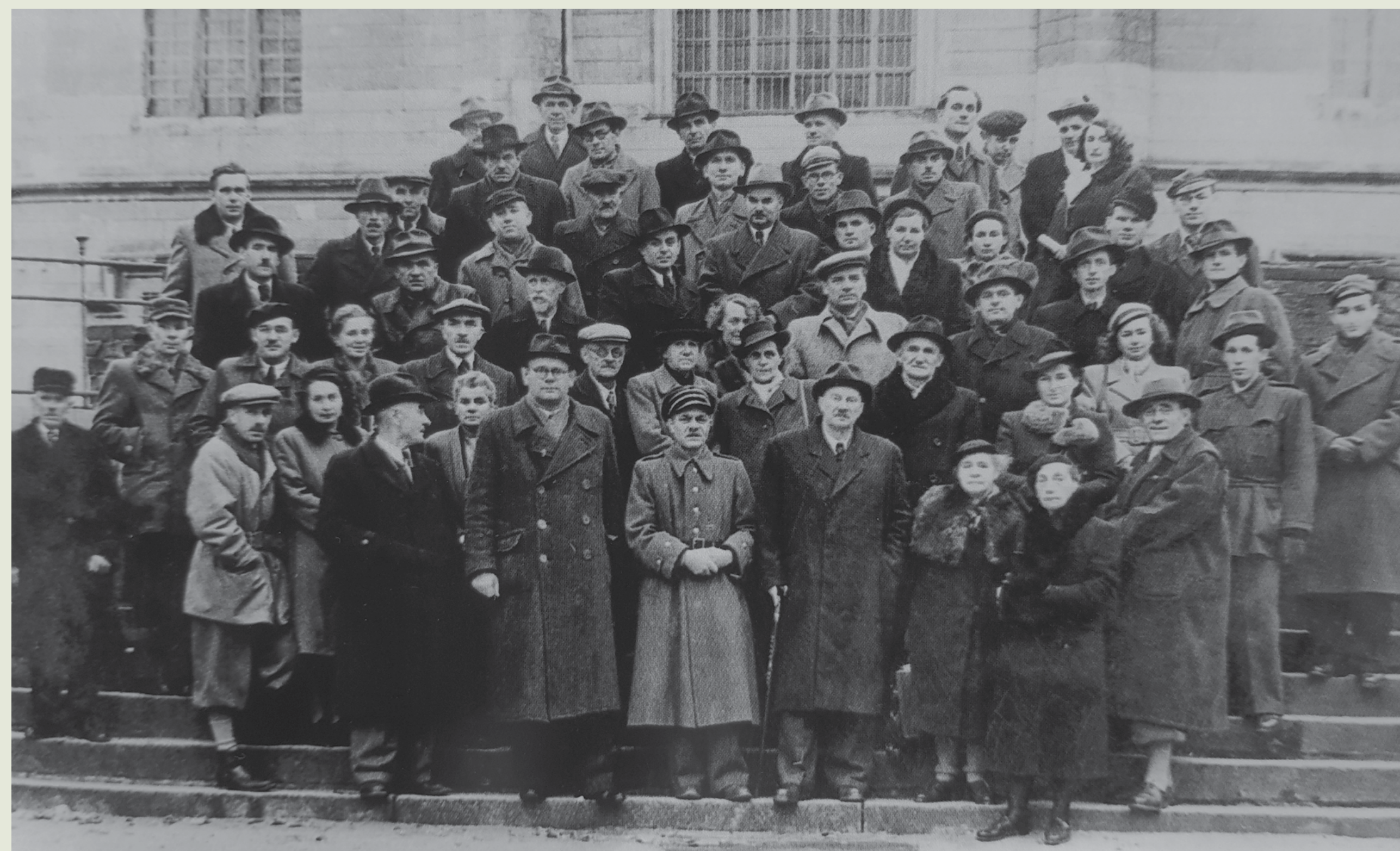
Pierwszy powojenny zjazd PTD w Kórniku, jesienią 1948 r. przed kórnickim zamkiem