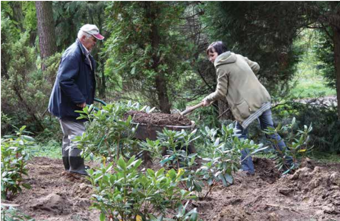
Sadzimy razem różaneczniki w Arboretum w Kórniku, rok 2009

We are planting azaleas at the Kórnik Arboretum, 2009